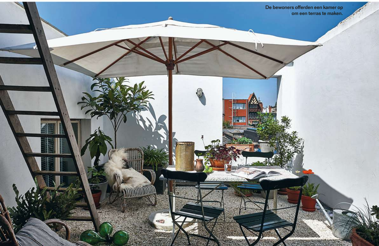
De bewoners offerden een kamer op om een terras te maken.