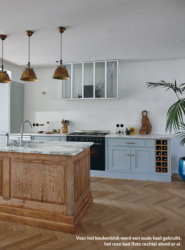
Voor het keukenblok werd een oude kast gebruikt, het roze bad (foto rechts) stond er al.