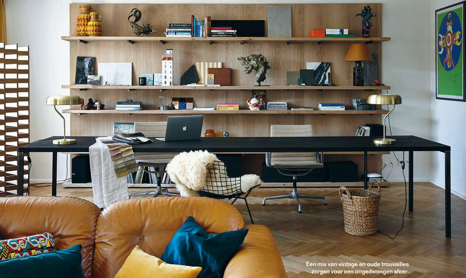
Een mix van vintage en oude trouvailles zorgen voor een ongedwongen sfeer.

E en paar goed gekozen ingrepen en je maakt in een handomdraai van een sombere woning een prettige woonplek”, vertelt interieurarchitect Ellen